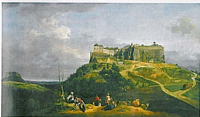
PEVNOST. TAKHLE JI ZACHYTL MALÍŘ CANALETTO V POLOVINĚ 18. STOLETÍ.

Starý a prudký vstup do pevnosti. Máme sice pohodlný výtah, ale vystoupat pěšky starou bránou je velmi romantické. ■■■